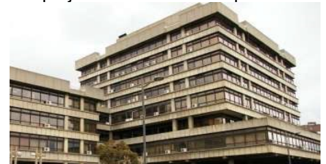
Fasada pre renoviranja