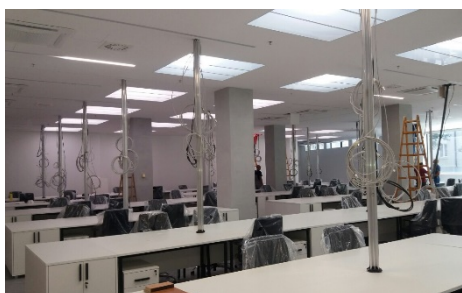
Kancelarija matične službe u prizemlju