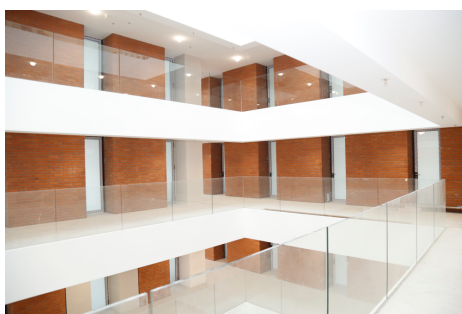
Hodnici u zgradi A