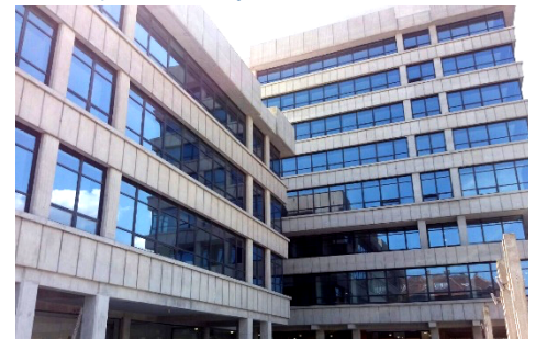
Fasada nakon renoviranja